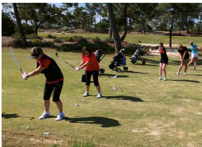
Damerne i gang med at træne shortgame

Vi blev sat i tre minibusser og så gik turen til Hamborg, videre til Lissabon i fly, og herfra igen i bus til hotellet på halvøen. Alt gik lige efter bogen, uden de store forsinkelser og vi ankom til hotellet sidst på eftermiddagen, hvor vi blev indlogeret og så var vi klar! Men der skulle en enkelt nattesøvn mere til, før vi langt om længe kunne komme i gang.