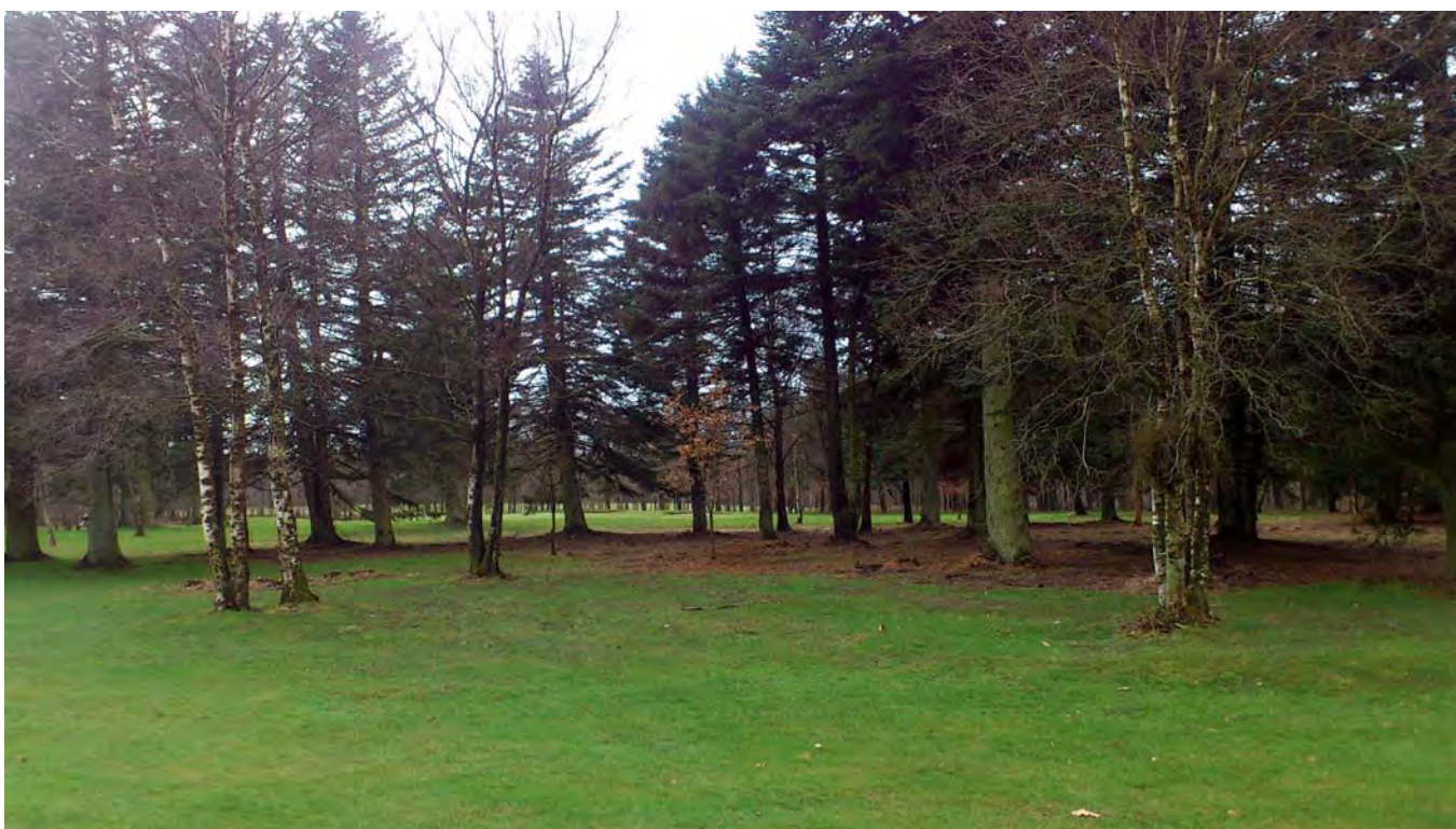
Nu er der mulighed for at finde sin bold ved "skævert" fra hul 1 på både Skoven og Sletten.