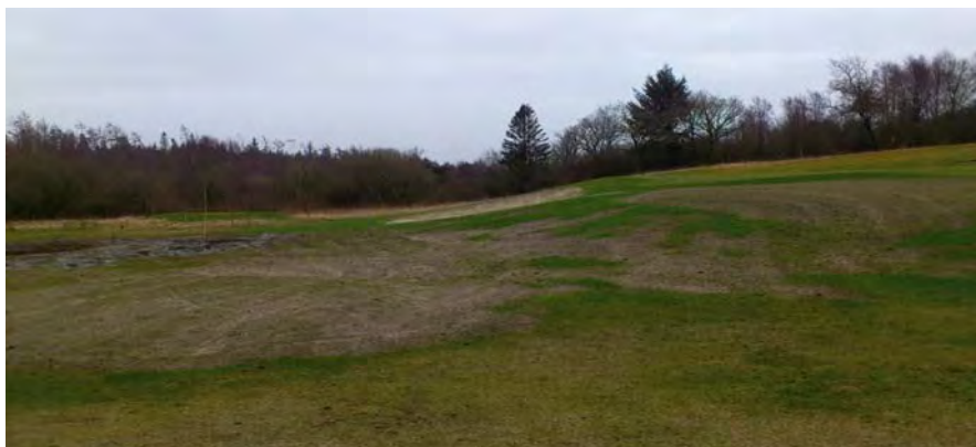
Slettens hul 6 – de 2 bunkers er erstattet med run-off område samt en forhøjning til vintergreen.