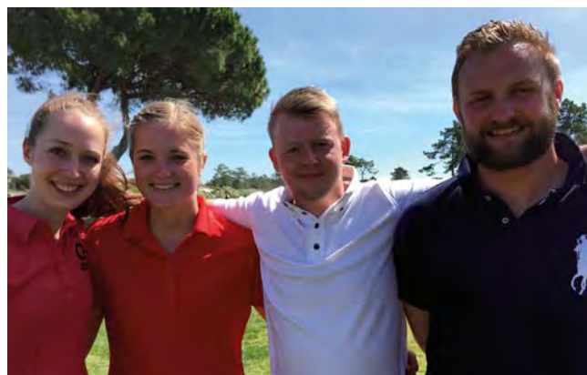
De fire skribenter.