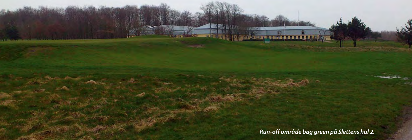
Run-off område bag green på Slettens hul 2.