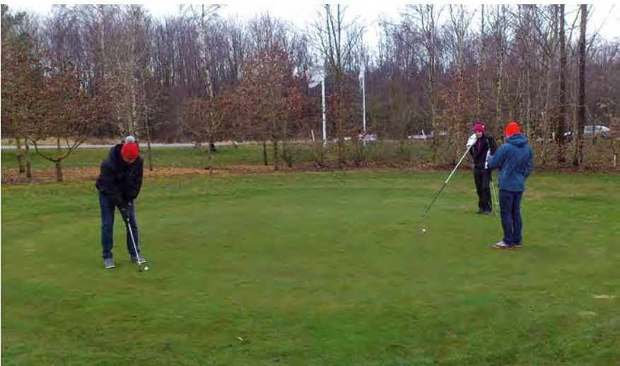
Her er de så på par-3 banen.