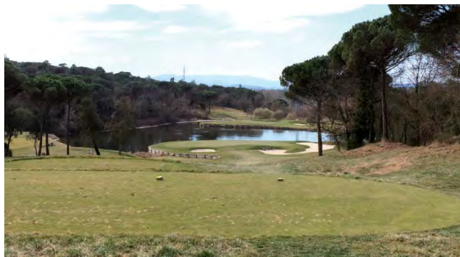
Et af mine absolutte favorithuller på PGA Catalunya, hul 11 på Stadium Course. Et kort, men yderst udfordrende par 3 hul på 160 meter.

På grund af det missede cut havde jeg en ekstra træningsdag inden næste turnering. Jeg havde en generel fornemmelse af, at jeg ikke havde udnyttet mine gode slag nok da bolden skulle de sidste meter på greens, jeg gik derfor i skarp træning på putting green! I løbet af de 3 dage skiftede vejret fra høj sol og 20 grader til bidende