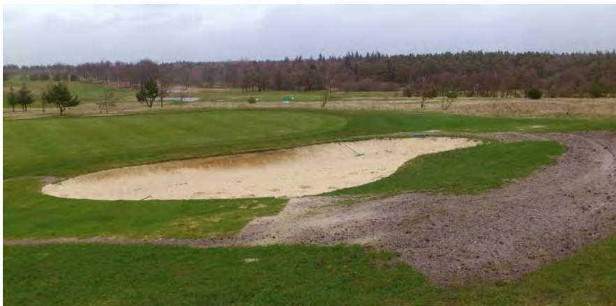
Skovens hul 5 – nu med afløb.

udbedret for at undgå regnvand fra de højere liggende områder løber ned i bunkerens og laver render.