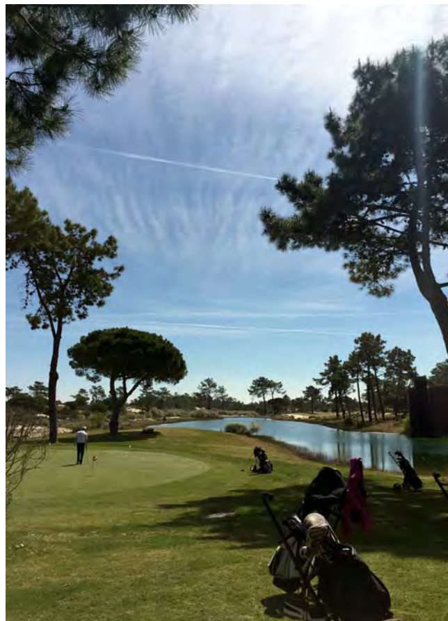
Putting green og udsigt til hvid tee på 1. hul

Søndag var vores sidste dag på Troia. For de som havde lyst, stod den på 18 huller tidligt om morgenen. Det