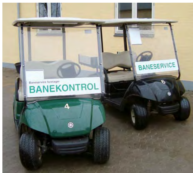
Dejligt at vi nu kan få mere gang i disse fremover!