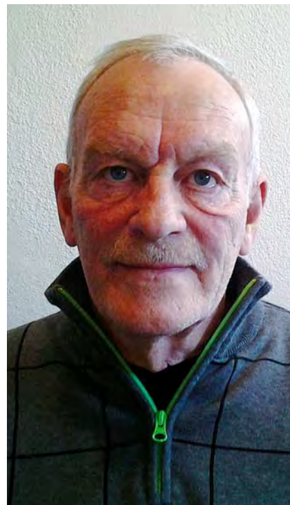
2014, samt regler og opgaver for Baneservice/Banekontrol kan læses på hjemmesiden.