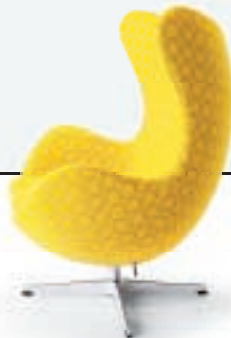
ÆGGET DESIGN: ARNE JACOBSEN