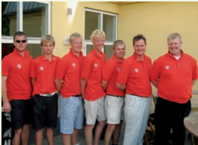
På grund af varmen var det i tredje og fjerde runde tilladt at spille i korte bukser!

Lørdag den 7. juni tog Breinholtgårds Divisionsherrer imod holdet fra Varde Golf Klub. Efter de tre foursomes var Breinholtgård oppe med 4-2. Efter frokosten blev der taget hul på singlerne, der gav sejr til Breinholtgård i fire ud af de seks singler. De to sidste singler blev delt. Det samlede resultat blev en sikker sejr i Breinholtgårds favør 14-4. En række af matcherne bød på megen spænding, og først