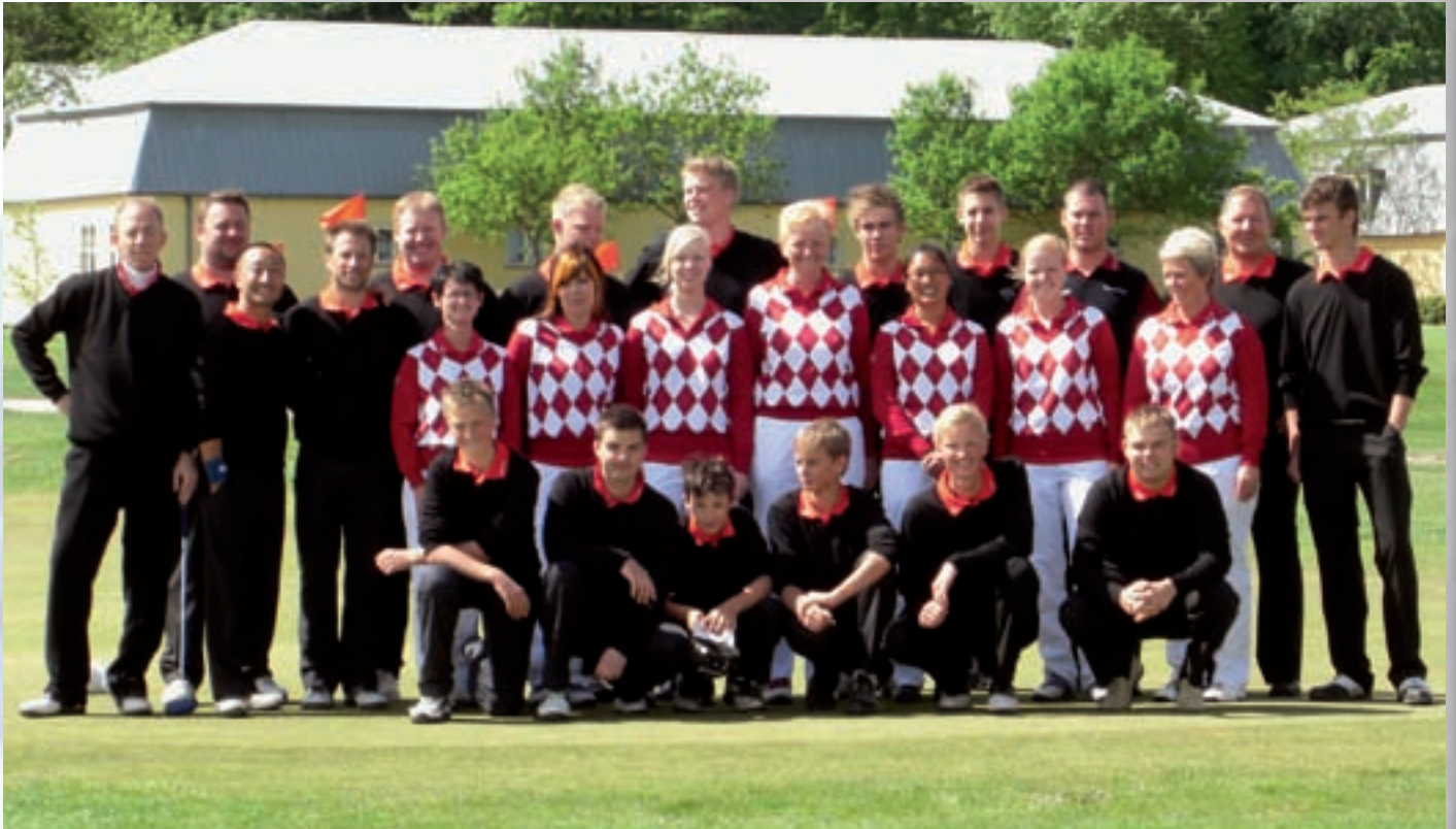
I forbindelse med årets første Elite-Am den 16. maj præsenterede elitespillerene deres nye tøj. Det ser jo flot ud og nu er det i hvert fald ikke påklædningen som skal stå i vejen for succes i Danmarksturneringen.