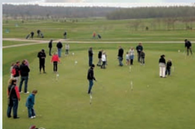
På billederne ses spillet på Sletten og fra den spændende puttekonkurrence...

Fra de unge mennesker og forældrene fik arrangementet stor ros, så mon ikke vi afholder det igen på et senere tidspunkt?