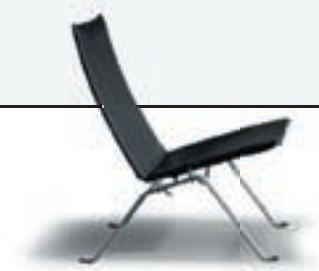
PK 22 DESIGN: POUL KJÆRHOLM