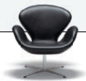
SVANEN DESIGN: ARNE JACOBSEN